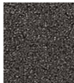
983 IRON ORE