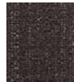
894 FIRST STEP