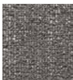
959 KICK OFF