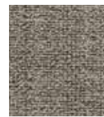
648 NEW BEGINNING