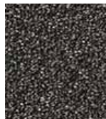
983 IRON ORE